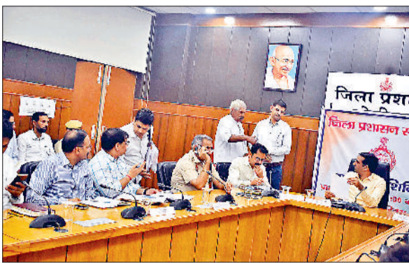
सोनीपत। अधिकारियों के साथ समाधान शिविर में लोगों की सुनवाई करते हुए उपायुक्त।

शुक्रवार को लघु सचिवालय के प्रथम तल पर समाधान शिविर का आयोजन किया गया। समाधान