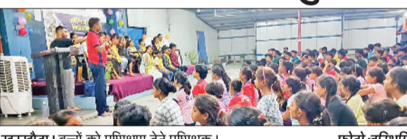
खरखोदा। बच्चों को प्रशिक्षण देते प्रशिक्षक।