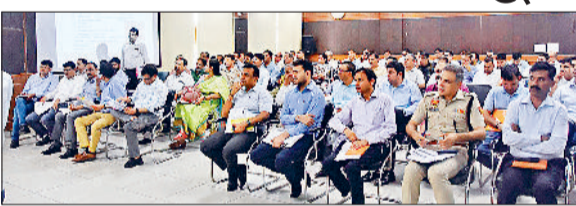
सोनीपत। बैठक में उपस्थित अधिकारियों।

उपायुक्त डॉ. मनोज कुमार ने अधिकारियों को निर्देश दिए कि जिला में विभिन्न योजनाओं को सीएम घोषणाओं को लेकर किए जा रहे विकास कार्यों में तेजी लाएं ताकि वे कार्य जल्द पूरे हो और लोगों को सुविधाएं हो सके। उन्होंने कहा कि अगर किसी कार्य को करने में कोई परेशानी आ रही है तो संबंधित अधिकारी उनसे बात करें ताकि उस परेशानी को दूर किया जा सके। उपायुक्त डॉ. मनोज कुमार ने शुक्रवार को लघु सचिवालय में आयोजित