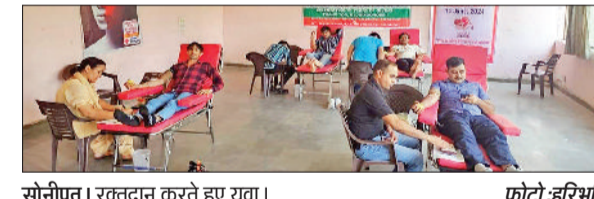
सोनीपत। रक्तदान करते हुए युवा।