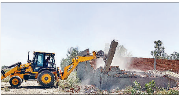
गन्नौर। बड़ी गांव में अवैध कालोनी में निर्माणधीन सर्विस स्टेशन को गिराते हुए जेसीबी।