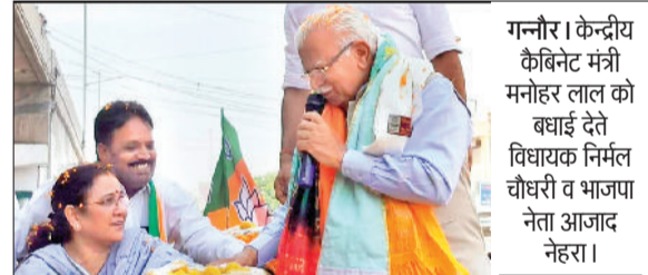
गन्नौर। केंद्रीय कैबिनेट मंत्री मनोहर लाल को बधाई देते विधायक निर्मल चौधरी व भाजपा नेता आजाद नेहरा।

गन्नौर। केंद्रीय ऊर्जा, आवास एवं शहरी कार्य मंत्री एवं हरियाणा के पूर्व मुख्यमंत्री मनोहर लाल का गन्नौर जीटी रोड चौक पर पहुंचने पर विधायक निर्मल चौधरी व भाजपा नेता आजाद सिंह नेहरा ने बधाई दी। इस अवसर पर अनेक भाजपा कार्यकर्ता भी उपस्थित थे। कष्ट निवारण समिति सदस्य योगेश कौशिक ने पटका पहनाकर स्वागत किया।